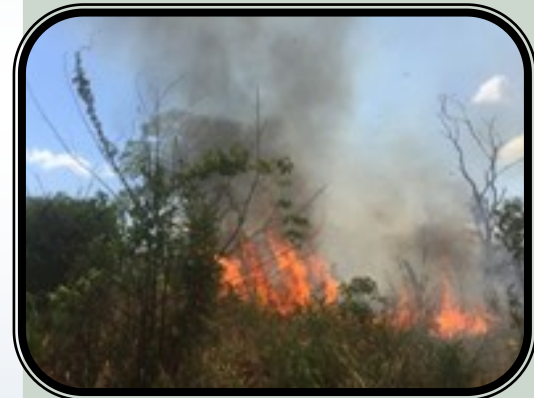
Asociación Balam, Marcando la Diferencia